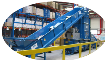
OPTION : CONVOYEUR