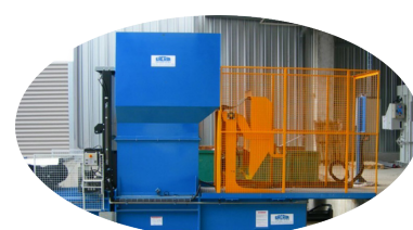
OPTION : LÈVE-CONTENEUR

Nous nous réservons le droit de modifier les spécificités sans préavis. Le poids des balles dépend du type de matériau