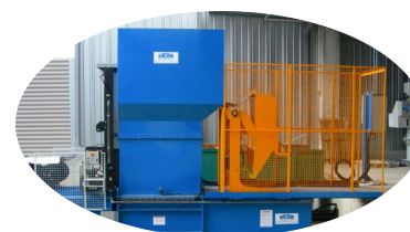
OPTION : LÈVE-CONTENEUR

Nous nous réservons le droit de modifier les spécificités sans préavis. Le poids des balles dépend du type de matériau