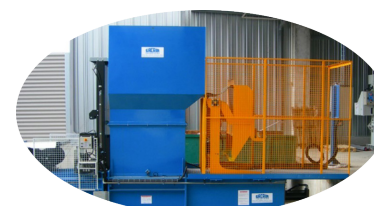
OPTION : LÈVE-CONTENEUR

Nous nous réservons le droit de modifier les spécificités sans préavis. Le poids des balles dépend du type de matériau