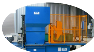
OPTION : LÈVE-CONTENEUR

Nous nous réservons le droit de modifier les spécificités sans préavis. Le poids des balles dépend du type de matériau